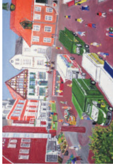
Unverkennbar: der Rathausmarkt von Eckernförde.

Kontakt und kostenloser Download des Kalenders unter www.wolfram-sieberth.de .